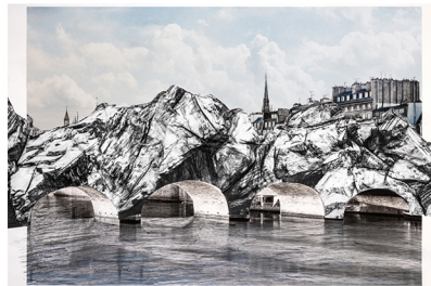
Illustration : CDN Paris.

Afin d'honorer l'œuvre de Christo, J. R. a créé "La Caverne", structure en forme de grottes emballant l'édifice. Visite gratuite de jour comme de nuit du 6 au 28 juin 2026.