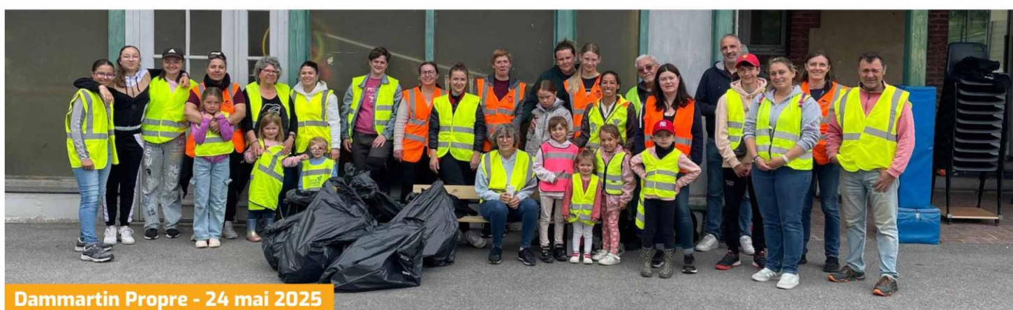
Dammartin Propre - 24 mai 2025