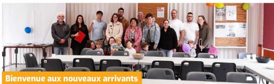
Bienvenue aux nouveaux arrivants