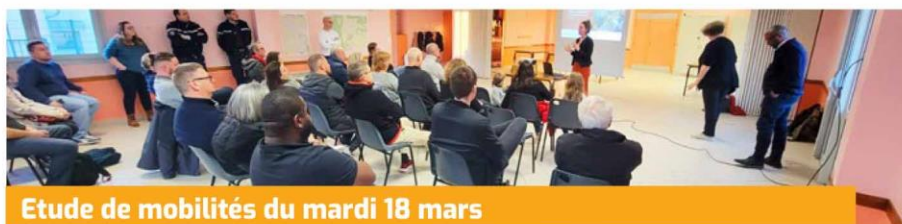
Etude de mobilités du mardi 18 mars