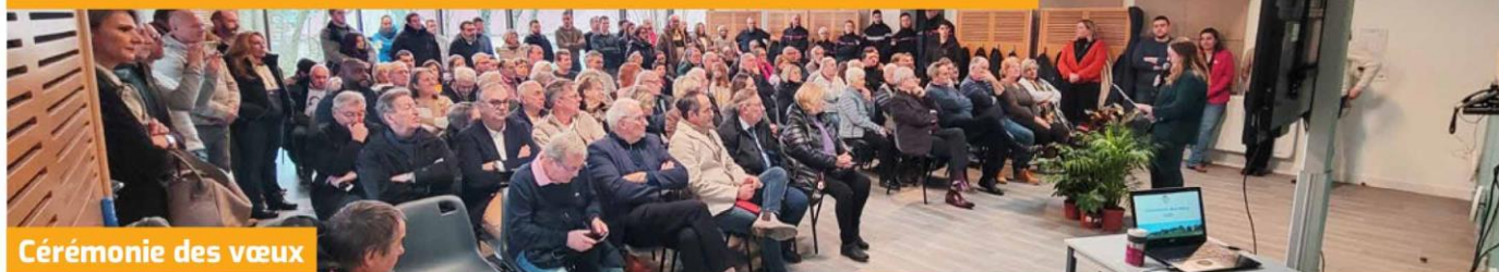
Cérémonie des vœux