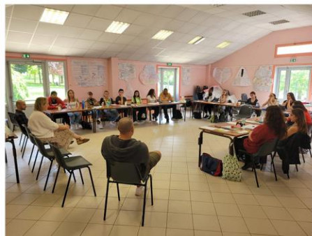
BAFA - Formation Générale du 1 er au 8 juillet (19 participants dont 2 Dammartinoises)