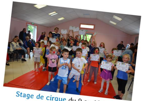
Stage de cirque du 9 au 12 juillet (35 participants)

Cette année, avec plus de 300 inscrits toutes catégories confondues, les 26 e Foulées Dammartinoises ont eu lieu ce 14 juillet. Au programme, des courses conviviales bien qu'éreintantes, se terminant avec la légendaire montée de la Grande rue. Parmi les coureurs, des Dammartinois (une dizaine) plus que jamais fiers de se mesurer à des coureurs chevronnés.