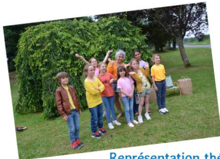
Représentation théâtre du 1 er juillet